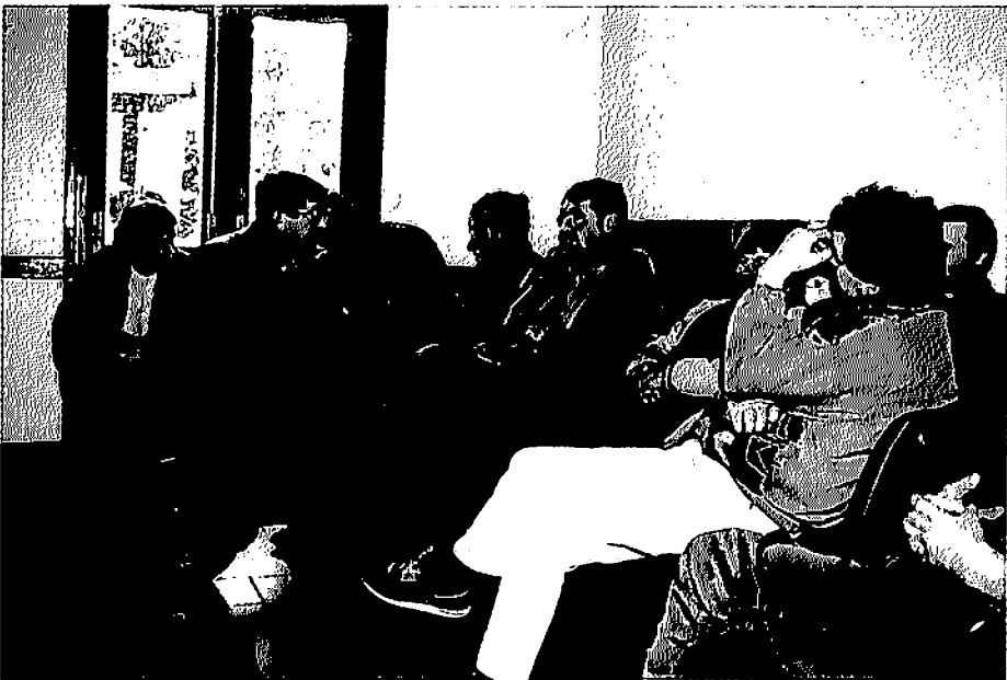
Dans le Cantal, des agriculteurs au cours d'une réunion

La coopération entre agriculteurs et techniciens exige d'abord la coopération, en termes d'échanges d'idées, entre les agriculteurs. C'est cette coopération entre eux qui leur assure les moyens d'être des interlocuteurs capables non seulement de concevoir leurs propres projets mais aussi de négocier, ajuster, s'approprier des propositions venant de l'extérieur. C'est en ces termes que l'on peut concevoir l'articulation entre les niveaux locaux d'action et « les tendances lourdes », perçues le plus souvent comme des contraintes que l'on ne peut que subir. Les groupes de réflexion du Cantal ont d'abord permis de favoriser, autant que possible, une marge de choix, en modifiant, au travers de la réflexion, la perception qu'ont les agriculteurs du contexte dans lequel ils vivent et travaillent et de ses effets, et d'y reconnaître leurs marges d'initiative.