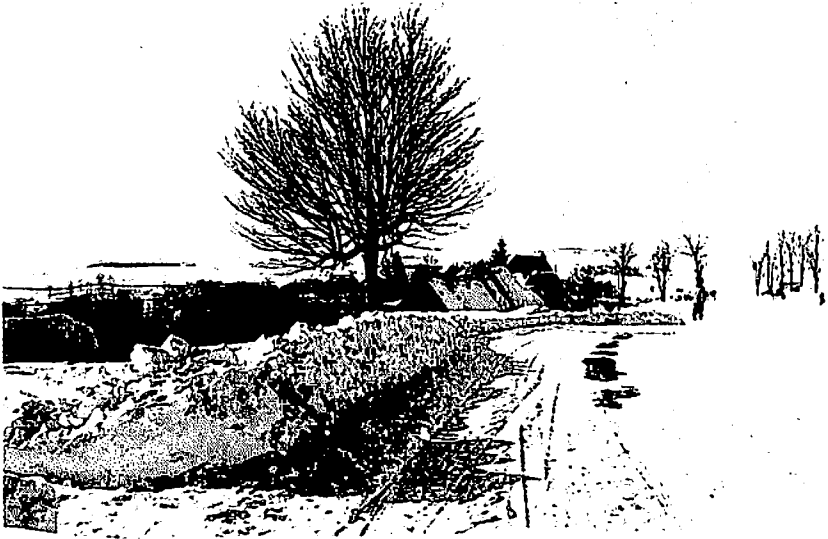
Le Cantal en hiver